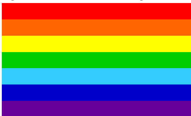
Figura 2: Primeira bandeira do Cooperativismo

As cores do arco-íris representam a nobreza e a grandiosidade de um símbolo da natureza em um conjunto de cores, cuja união significa a paz após a tormenta. Cada uma destas cores tem um significado próprio: