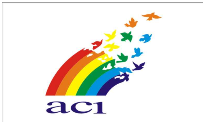
Figura3 : Atual bandeira do Cooperativismo

A bandeira que substituiu a tradicional do arco-íris, que esta representada na Figura 3, é de cor branca e tem o logotipo da ACI impresso no centro, do qual emergem pombas da paz, representado a união dos diversos membros da ACI. O logotipo foi aprovado em 1995 por ocasião do centenário da ACI. O arco-íris é representado em seis cores e a sigla ACI esta impressa na sétima cor: o violeta.